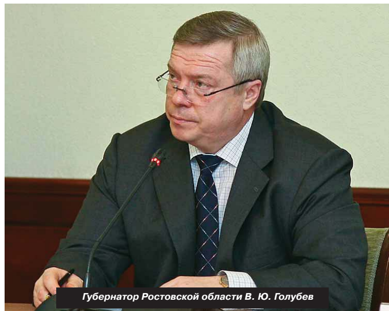
Губернатор Ростовской области В. Ю. Голубев

щей недели разобраться с этим вопросом и "привести в нормальное состояние эту ситуацию".