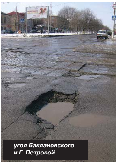
угол Баклановского и Г. Петровой

Этого можно было бы избежать, если бы снег, как это положено, вывозился бы с улиц. Но хочется как лучше, а получается-то все равно как всегда. В итоге сейчас город "затоплен". Автомобильные колеса в некоторых местах практически целиком погружаются в поток (и это еще повезет, если водитель знает все неровности асфальта "наощупь" и не влетит в яму, не замеченную из-за глубокой лужи). Пешеходы перемещаются непонятными скачками и по самому краю тротуара (потому