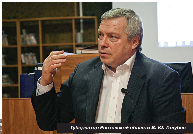
Губернатор Ростовской области В. Ю. Голубев

Дело в том, что у нас итак самый низкий уровень безработицы в области. Но это осуществляется за счёт Ростова, и