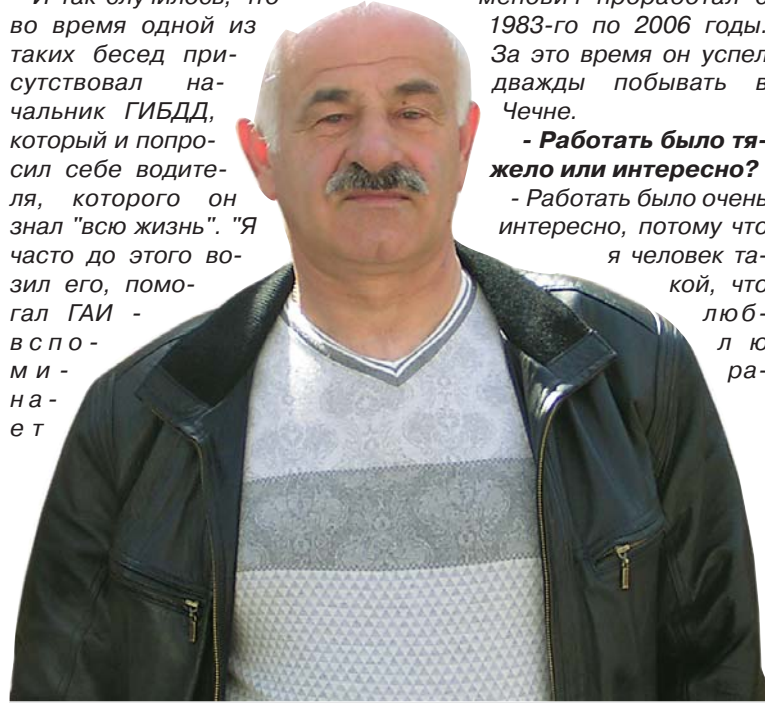
Бывший сотрудник ГИБДД рассказал о том, как задерживал преступников

И так случилось, что во время одной из таких бесед присутствовал начальник ГИБДД, который и попросил себе водителя, которого он знал "всю жизнь". "Я часто до этого возил его, помогал ГАИ - вспоминает