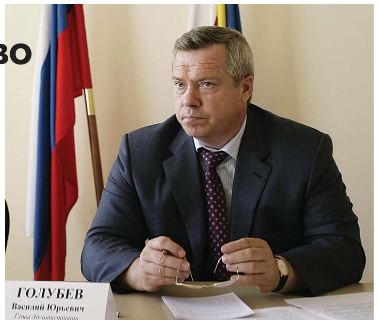
ГОЛУБЕВ Василий Юрьевич Глава Администрации

В неудовлетворительном состоянии находятся дороги, контейнерные площадки и прилегающая к ним территория в Ростове-на-Дону, Шахтах, Волгодонске, Новочер-