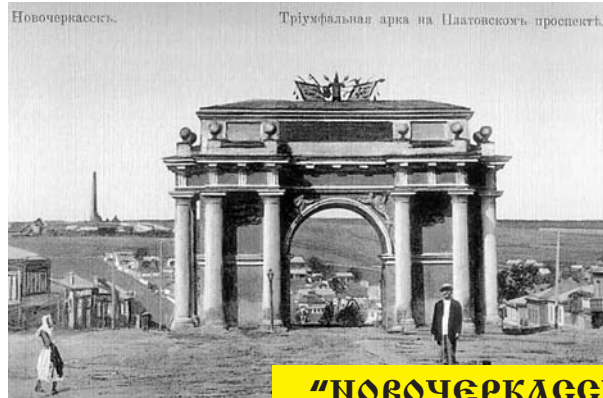
"НОВОЧЕРКАССК 100 лет спустя"